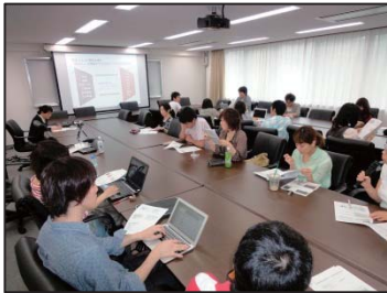
「日本の労働世界とジェンダー」の講義風景

ASNET機構は、今後も『アジアの環境研究の最前線』科目を続けることで、東京大学の大学院生たちにアジアのことを広く、そして深く理解してもらいたいと考えています。