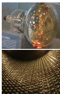
小柴ホールにある 展示用増倍管（上） とスーパーカミオ カンデ内の増倍管

われらが東京大学の「貯蔵品」は、岐阜県飛騨市神岡鉱山の中にある光電子増倍管です。目に見えない弱い光を検出する高感度センサーですが、宇宙線からニュートリノを取り出すためには、更に性能の良い直径50センチの特注品が大量に必要です。複雑な製造工程、多額のコスト（@約30万円）がかかるため、いざという時に備え、日頃からストックは欠かせないのです。